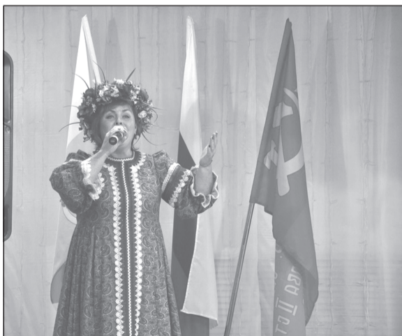
Ю. Жукова. «Гляжу в озёра синие»