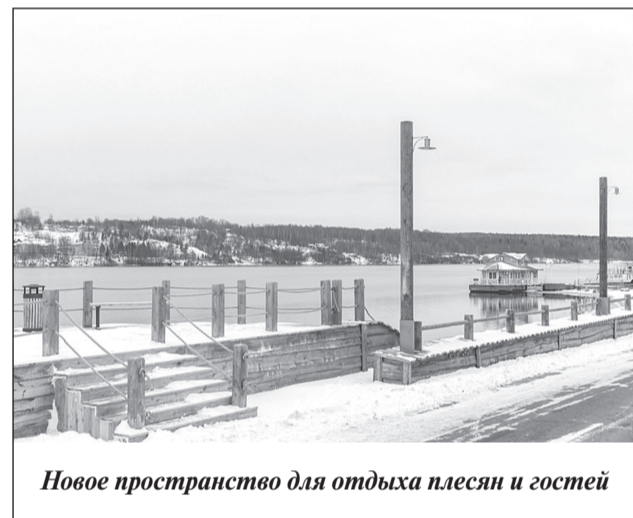
Новое пространство для отдыха плесян и гостей

В Плесе появилось новое общественное пространство для отдыха горожан: сквер «Левитановский берег» открылся после реконструкции. Часть набережной площадью 5000 кв.м теперь доступна для прогулок, а в сезон – для пляжного отдыха.