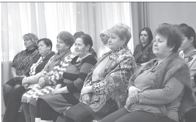
Наши ветераны - всегда в первых рядах

В Приволжском районе в рамках областного марафона «Герои Отечества» прошёл целый цикл мероприятий, одним из которых была встреча в общественном историко-краеведческом музее Приволжска. В малый зал город-