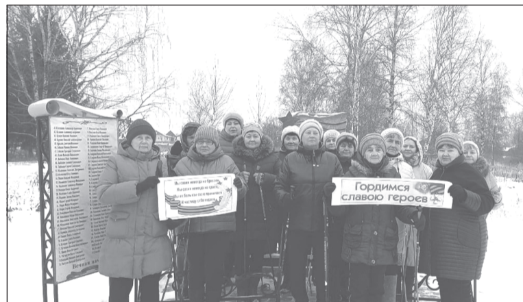
Памятный маршрут мимо домов односельчан-фронтовиков

Депутаты фракции «ЕР» в Совете Рождественского сельского поселения совместно с группой любителей северной ходьбы прошли памятным маршрутом мимо домов, в которых проживали их односельчане погибшие в годы войны. У памятника погибшим воинам возложили цветы и почтили память минутой молчания.