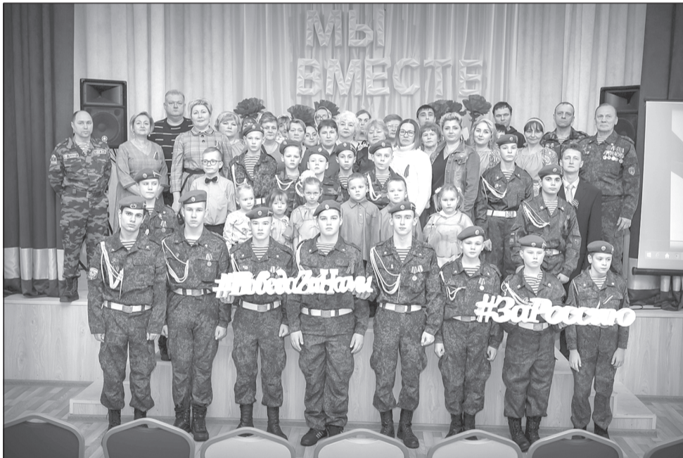
Победа за нами! Участники концерта в с. Толпыгино

В День Героев Отечества в Толпыгинском доме культуры не хватало мест для зрителей – наблюдался настоящий аншлаг!