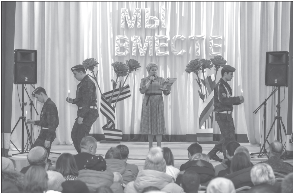
Этот концерт надолго останется в памяти присутствующих