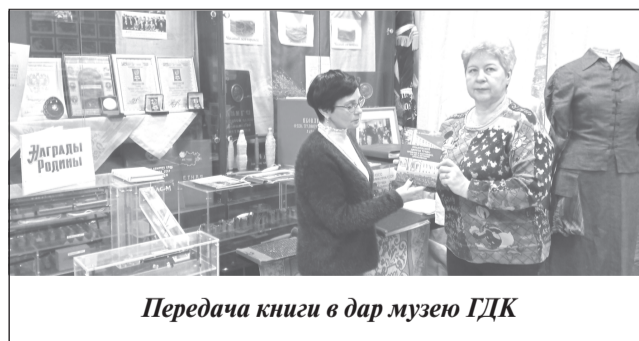
Передача книги в дар музею ГДК

Фонды общественного историко-краеведческого музея г.Приволжска пополнились благодарю Ивановскому областному объединению организаций профсоюзов.