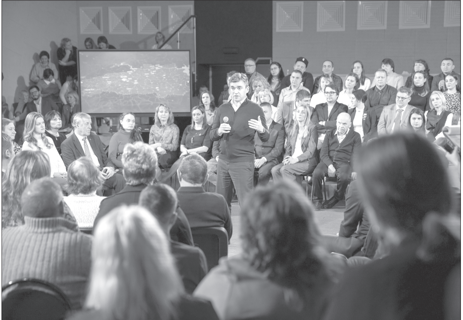
Впервые встреча с жителями прошла в «Солярисе».

8 декабря Станислав Воскресенский провел традиционную итоговую встречу с жителями региона – на этот раз в новом ивановском образовательном центре для одаренных детей «Солярис». Жители спросили губернатора о ремонте и строительстве дорог, решениях в медицине, о программе местных инициатив, поддержке участников СВО, экономике... По некоторым вопросам глава региона озвучил решения прямо в зале.