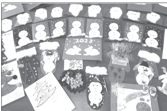
Главное пожелание бойцам - скорейшей победы над врагом

По всей нашей огромной стране проходит акция новогодних открыток для бойцов СВО - «Новогодняя почта».