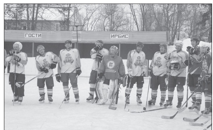
Команда «Ирбис». Фото из архива редакции 2019 г

Минувшие дожди и снегопады нанесли урон ледовым аренам района. И теперь тем, кто содержит лёд, придётся затратить много усилий, чтобы вернуть его к жизни. Цените их труд, любители покататься, и помните, что кому-то приходится и саночки возить.