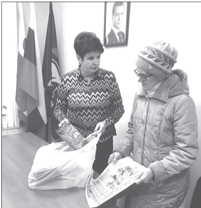
Каждый посетитель нуждается в дельном совете, сочувствии, участии

В связи с 21-летием партии «ЕР» с 1 по 10 декабря в общественной приемной прошла декада приёмов граждан.