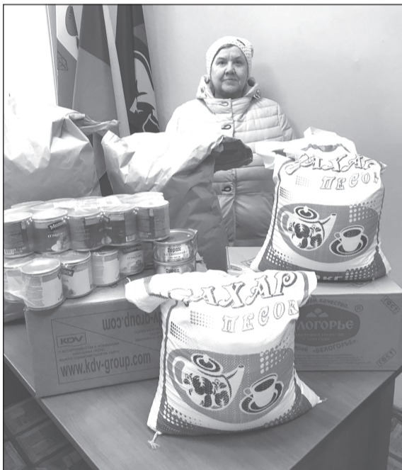
У ребят должно быть всё необходимое - уверены участники благотворительной акции

Спасибо всем огромное за заботу! Всё будет доставлено по назначению в ближайшее время.