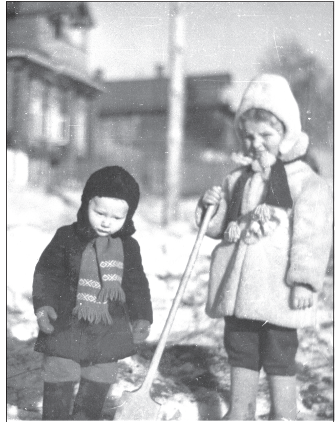
Зима морозная, снежная, сказочная

Тогда особенно ценишь тепло дома, где можно прислониться к тёплому боку печки, закинуть на неё обледелые варежки и валенки или посмотреть, как разгорается внутри её огонь, но это только с утра, когда печь