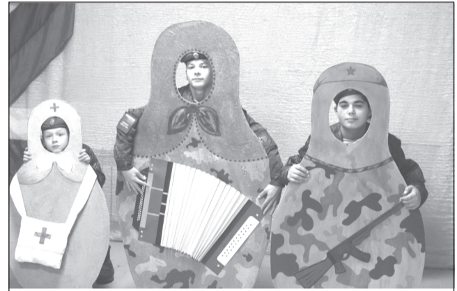
Нынче в моде камуфляж

Тонкой нитью сквозь концерт прошла тема года культурного наследия народов России. Он завершается. И одним из напоминаний об этом стали конфеты и баранки, как знак русского гостеприимства, которыми угощали гостей концерта, да и матрёшки для фотозоны были в его стиле - хоть и в камуфляже.